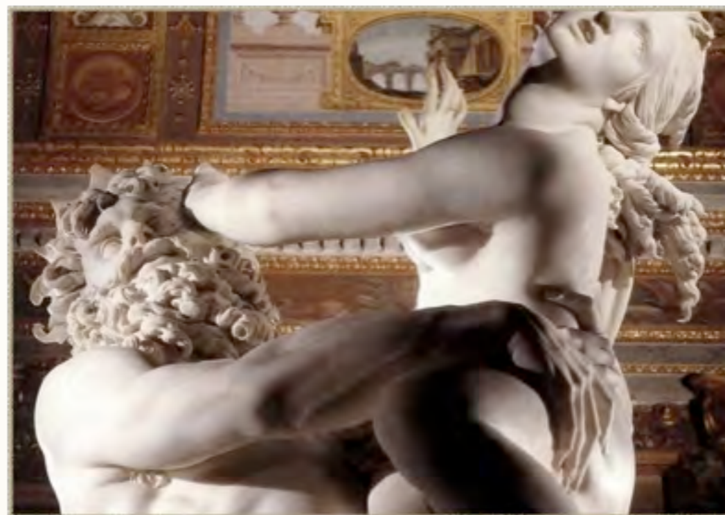
(Bernini, ratto di Kore - particolare)