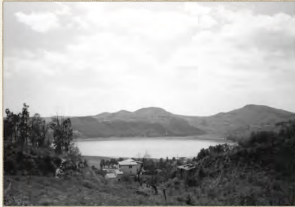
LAGO DI PERGUSA (ENNA)

Tra i miti più suggestivi, di cui la Sicilia è particolarmente ricca, spicca quello di Kore (o Persefone, chiamata in seguito Proserpina dai Romani), e del suo rapimento avvenuto, secondo la versione più accreditata, in un prato meraviglioso che si estendeva ai piedi del monte su cui sorge la città di Enna, presso le rive del lago di Pergusa, ad opera di Ade, il tenebroso dio dei morti.