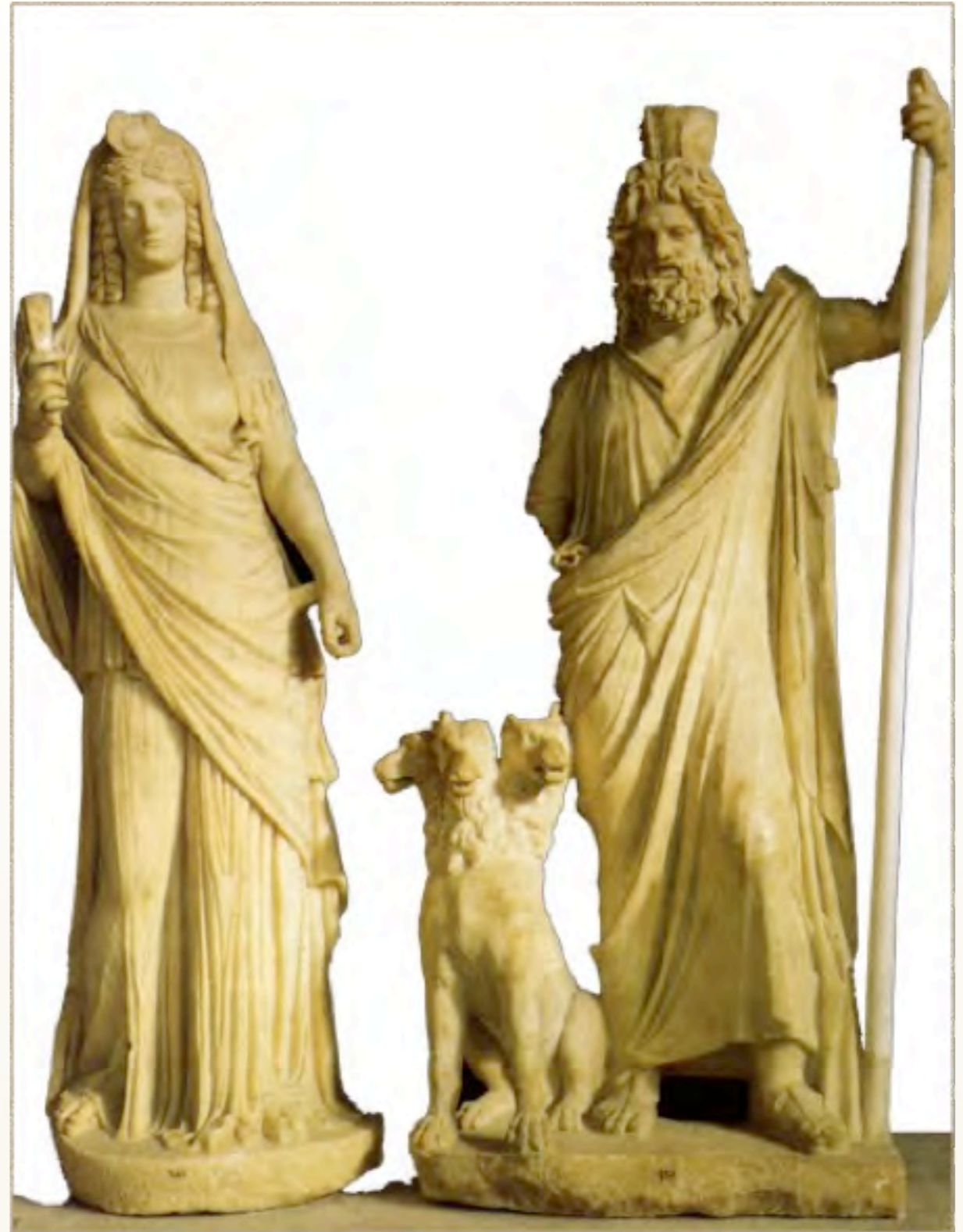
Ade, Persefone e il cane Cerbero